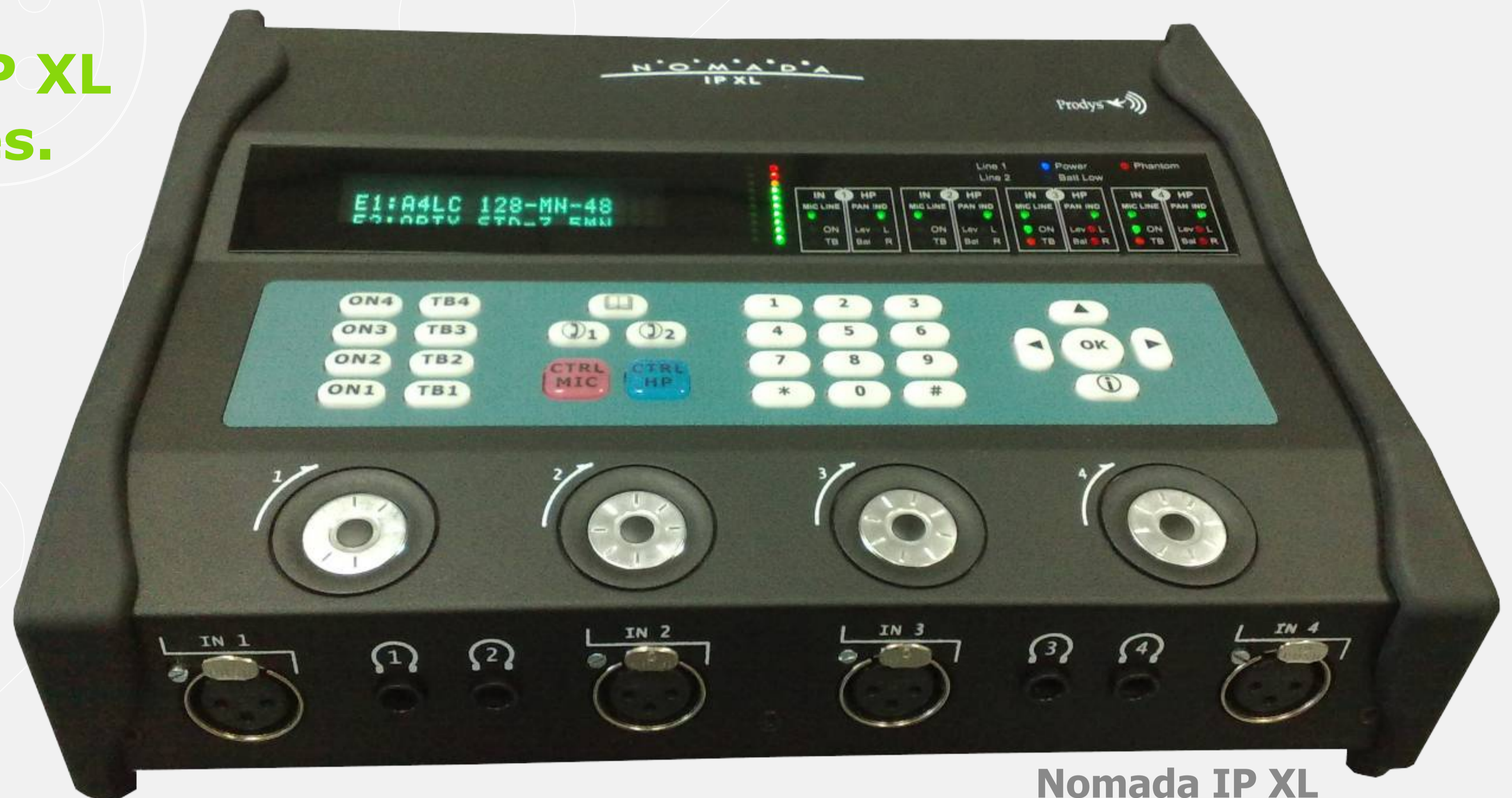
Nomada IP XL

Nomada IP XL: audiocodificador portátil con 4 entradas de audio.