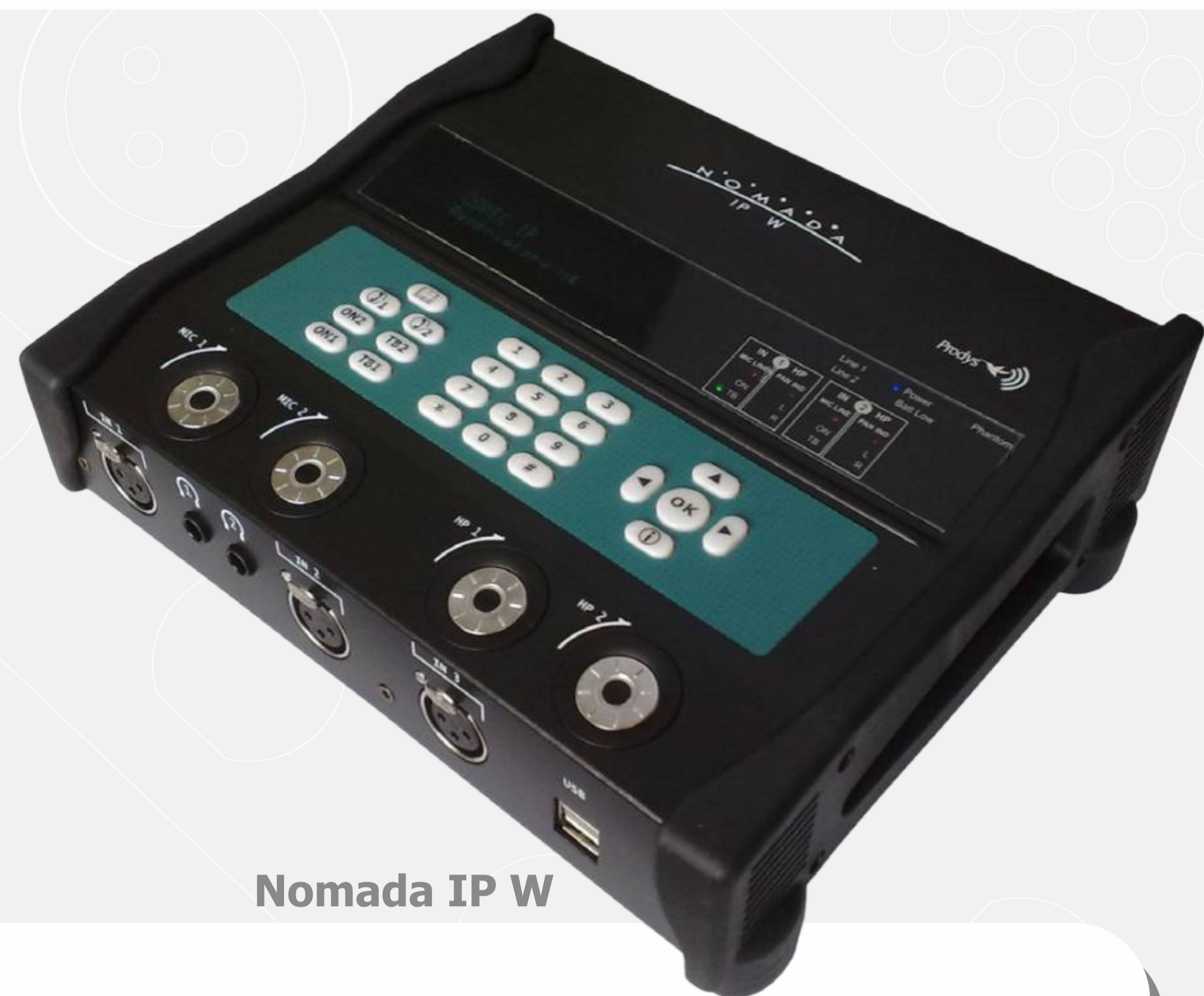
Nomada IP W